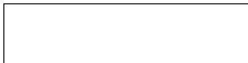
Схема границы эксплуатационной ответственности

е) локальные очистные сооружения на объекте _____ (есть/нет).